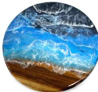
Modelo Pacífico 14"x14"