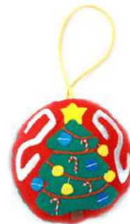
Modelo E 3X3"