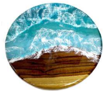
Modelo Caribe 14"x14"