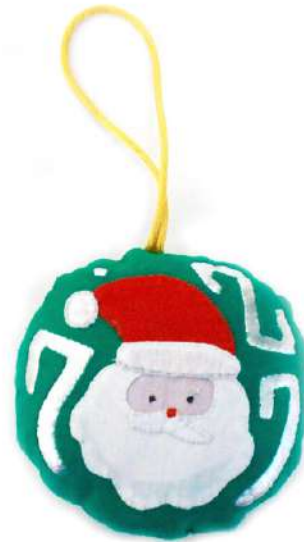
Modelo B 3X3"