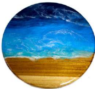
Modelo Atlántico 14"x14"