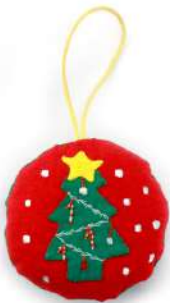
Modelo C 3X3"