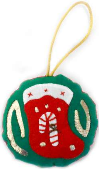
Modelo A 3X3"