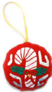
Modelo D 3X3"